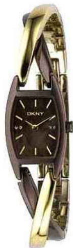
DKNY Trophee Ormania catégorie horlogerie montre dame

MONTRE DE L'ANNEE : DKNY, Viceroy, Fontenay Studio