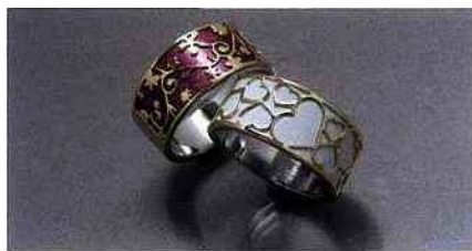
Lionel faivre pour FGB - Bagues en or