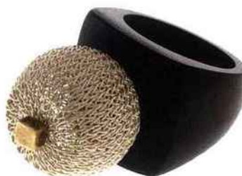
Gamlane - bague en argent tressé et ébène