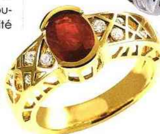
H Gringoire - Bague or et rubis