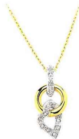
Julien d'Orcel Trophee Ormania catégorie Coup de cœur Pendentif cœur or et diamants