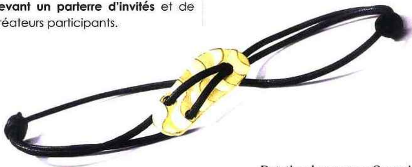
Dotation du concours Ormania Bracelet Jean Marc Garel or et cuir

ANTICA MURRINA - APH PERLE DE CULTURE - APRIL PARIS - ARGE - ASCENDANCE - ATLANTIC ETALAGES - BACIO - BIJOUX DES REGIONS DE FRANCE - BIJOUX ML - BLUMER - BREUNING - BUFFILOR - CAS BERNARD - CEIA - CERFAGLI - CERTUS - CIMO - CHARMING - CLAUDIO FACCIN - COINDRE STEINER/TACHE ALLIANCES - CS BIJOUX - DI PERLE - DUPRE DALIA - EMASUR - ENVISIONTEC - EUROPEAN TIME - EZ DIAMONDS - FGB - FG BIJOUX - FLEURUS - GAMLANE - Gc - GO - GROUPE VENDÔME - GUESS - HAYA GEMS - HECTOR H - H.GRINGOIRE - IBB PARIS - ICE WATCH - INORI - INTERNATIONAL DIAMOND IMPORTER - ISABELLE LANGLOIS - J'AI L'OR - JMP3 - JUTLANDICA - LAVAL - LES MERVEILLES DU PACIFIQUE - LUCAS LUCOR - MARC ECKO - MONNAIE DE PARIS - MONTRES LEGO - MONTRES WIT - MORINI GIOIELLI - NATURE D'AMBRE - NEGOCE ILES - NIKI - OFFICINA DEL TEMPO - OROTIME - PACOMA - PATTON - PEARL DESIGN FRANCE - PESAVENTO - RAPPORT - ROCHET - RODANIA - SKAGEN - SCHMITTGALL - SCHULTHEISS - SILVER DESIGN - SISMA - SMB - SOCIETE ERIC - SOGNI - SWISS KUBIK - TACHE DIAMONDS - TAHIZEA - TECHNOCAST - TEKDAY - TIME DISTRIBUTION - TI SENTO - TOURNAIRE - TROLLBEADS - UNA STORIA - VANADIUM - VERNET DRAY - WEGELIN - ZENO WATCH - ZUCCOLO ROCHET - ZRC.