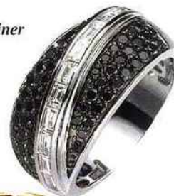
Coindre & Steiner Bague en or et diamants

Deux jours pour se décider, sélectionner les bijoux des vitrines de Noël, puis retourner travailler, ouvrir son magasin pour les bijoutiers, ou circuler avec leurs collections pour les fabricants et leurs représentants. Un programme bien rempli pour un maximum d'efficacité.