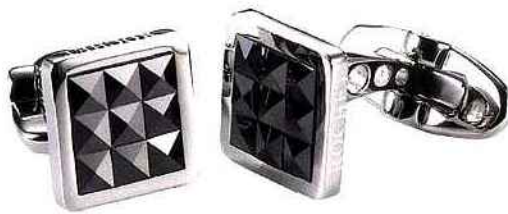
Rochet. Boutons de manchette ligne Pitlane en acier et céramique facettée.