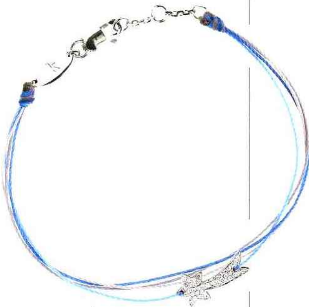
Red Line. Bracelet multi-fils ligne Etoile Filante en or blanc pavage de diamants.