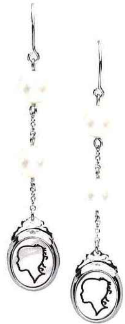
Mademoiselle est Précieuse. Boucles d'oreille en argent et perles de culture d'eau douce. Distribution Schmittgall.