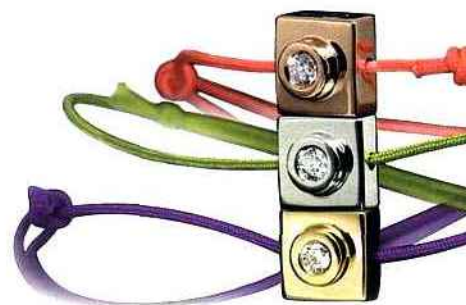
Chalvet Paris. Bracelets Bricc, collection ludique en or et diamants, souvenir des briques de notre enfance.