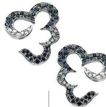
Van Cleef & Arpels. Broche Papillon Bel-Argus en or blanc, diamants et saphirs multicolores.