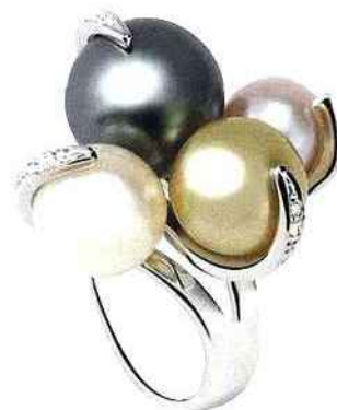
Schmittgall. Bague en or blanc ornée de diamants et perles de culture (Tahiti, Akoya, mers du Sud).