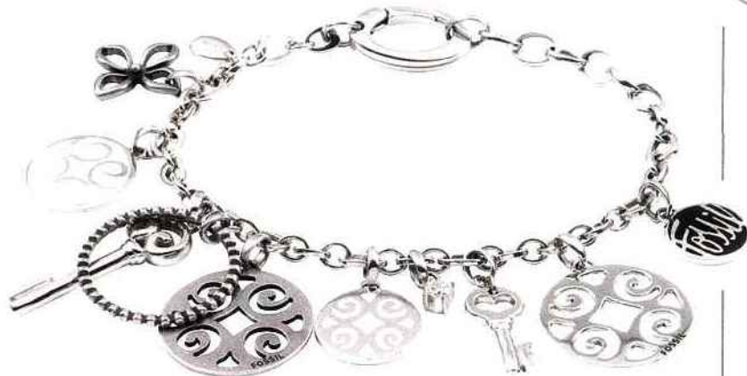
Fossil. Bracelet médaillles porte- bonheur en acier poli et acier vieilli.