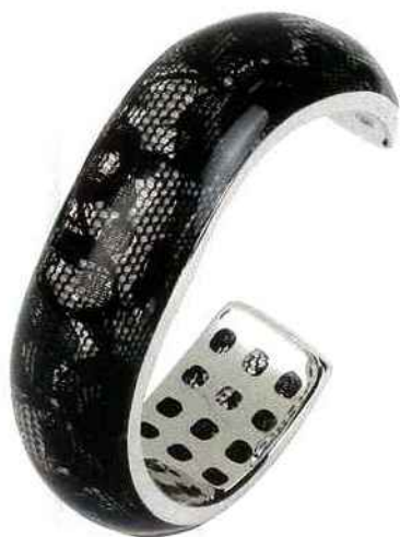
Cobra. Manchette en argent 925 millièmes, résine et dentelle.