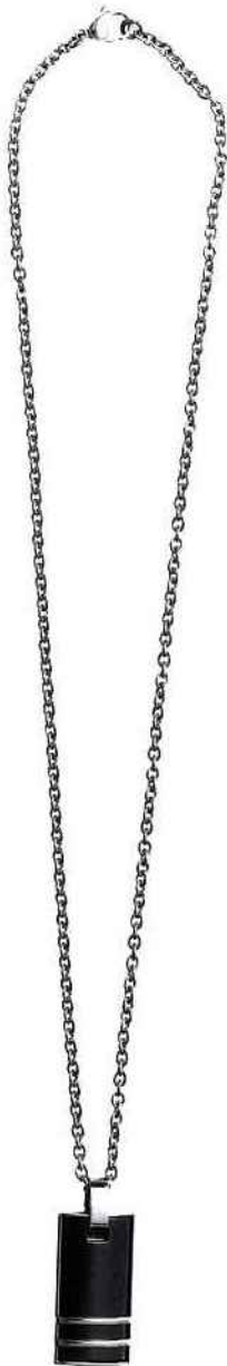
Phébus. Pendentif acier et céramique noire, ligne Black Label.