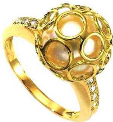
Porchet. Bague Bubble en or jaune avec perle de culture de 11 mm et diamants.