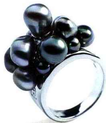
GI. Fashion. Bague en argent et oxydes de zirconium ligne Arletti.