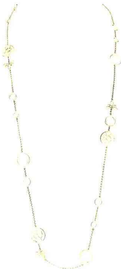
Chanmet. Sautoir "Attrape-moi... si tu m'aimes" en or jaune qui représente la danse des abeilles.